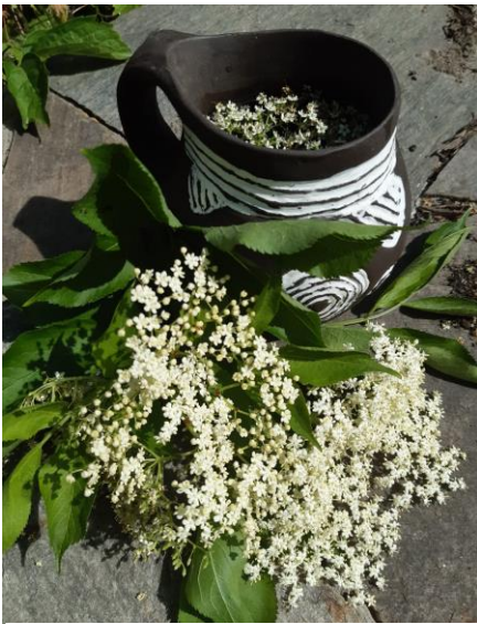
Frischer Holunderblütensaft im Mondseekrug.

denen keine Läuse sitzen und immer nur so viel wie du brauchst. Schüttele die Dolden vorsichtig, falls noch Käfer und andere Tierchen darauf sitzen oder lasse sie daheim ein paar Minuten in der Küche liegen, damit diese flüchten können.