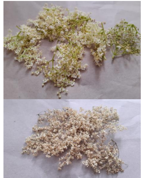
Die Holunderblüten im frischen und getrockneten Zustand.