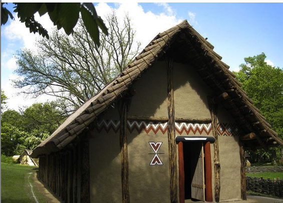
Rekonstruktion eines jungsteinzeitlichen Hauses im Urgeschichtemuseum Asparn an der Zaya.

Auch Eier wurden schon lange vor der Entstehung des Christentums bemalt und verziert. Die ältesten Funde stammen aus dem südlichen Afrika und sind 60.000 Jahre alt. Auch in sumerischen und ägyptischen Gräbern finden sich bemalte Straußeneier.