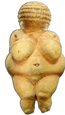
Die berühmte Venus von Willendorf.

Dafür kamen unterschiedliche Färberpflanzen, wie Färberwau, Waid oder Färberkamille zum Einsatz, genauso wie mineralische Stoffe wie Kalk, Rötel oder Ocker.